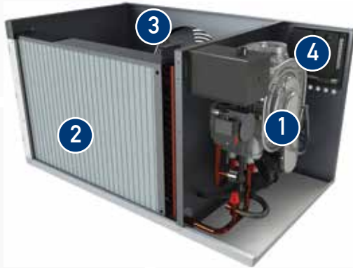
1 Yoğuşmalı Boyler